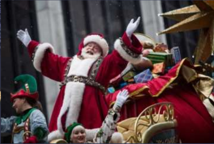
Баббо Натале и Ла Бефана (Италия)