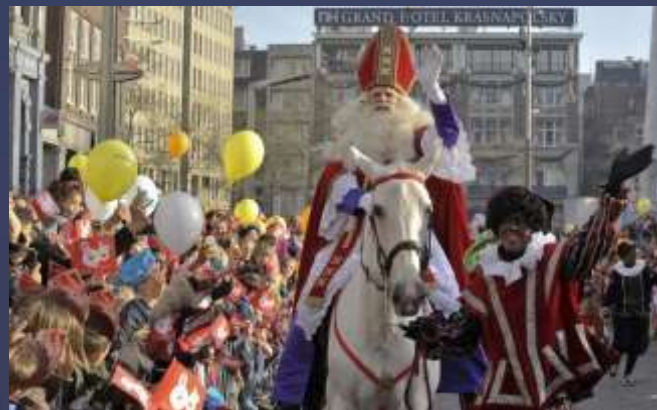
Святой Николай (Нидерланды и Бельгия)