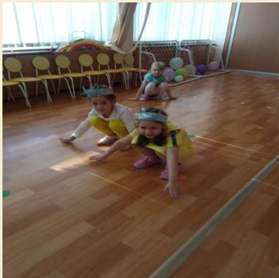
Подвижная игра: «Самолеты».