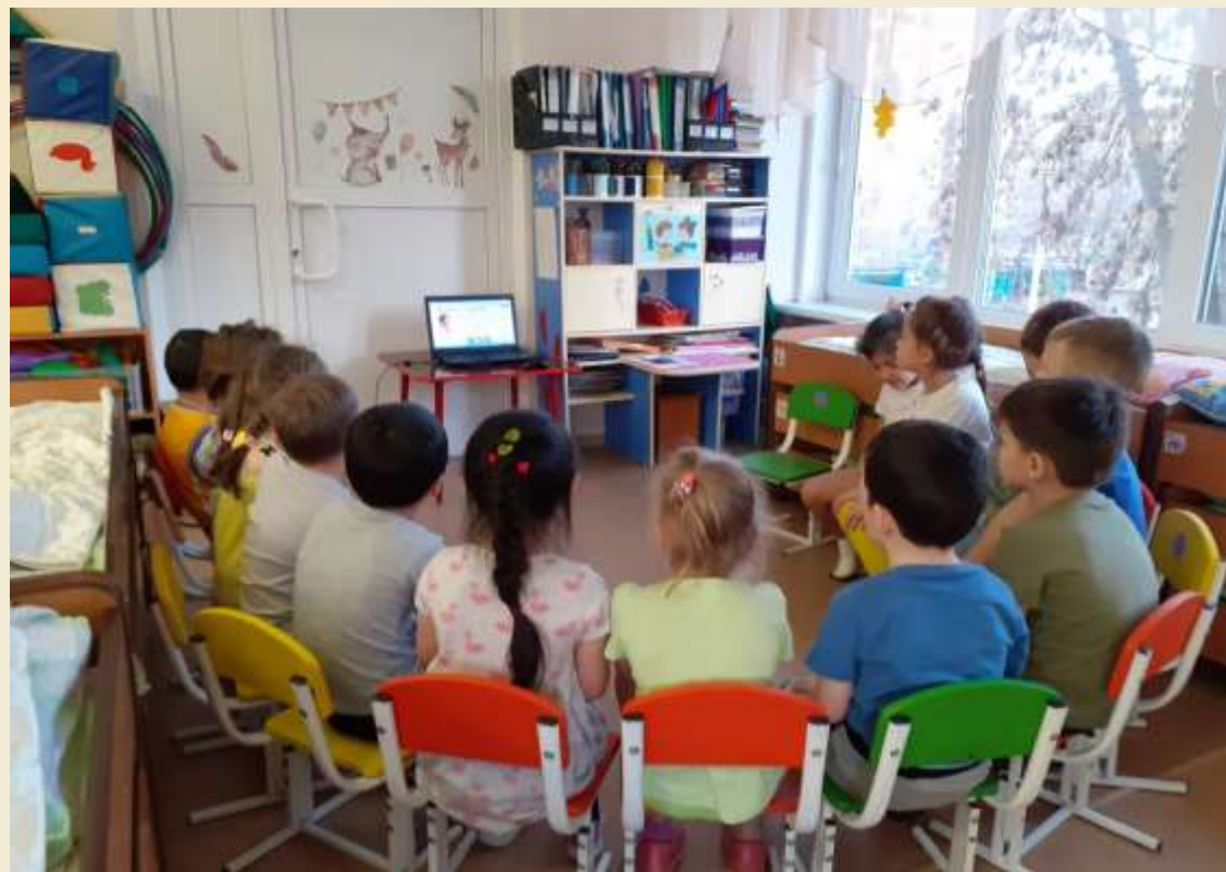
Просмотр презентации: «Пионеры- герои».