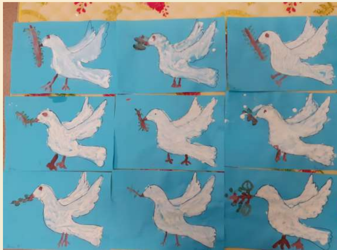
Рисование голубей- мира.