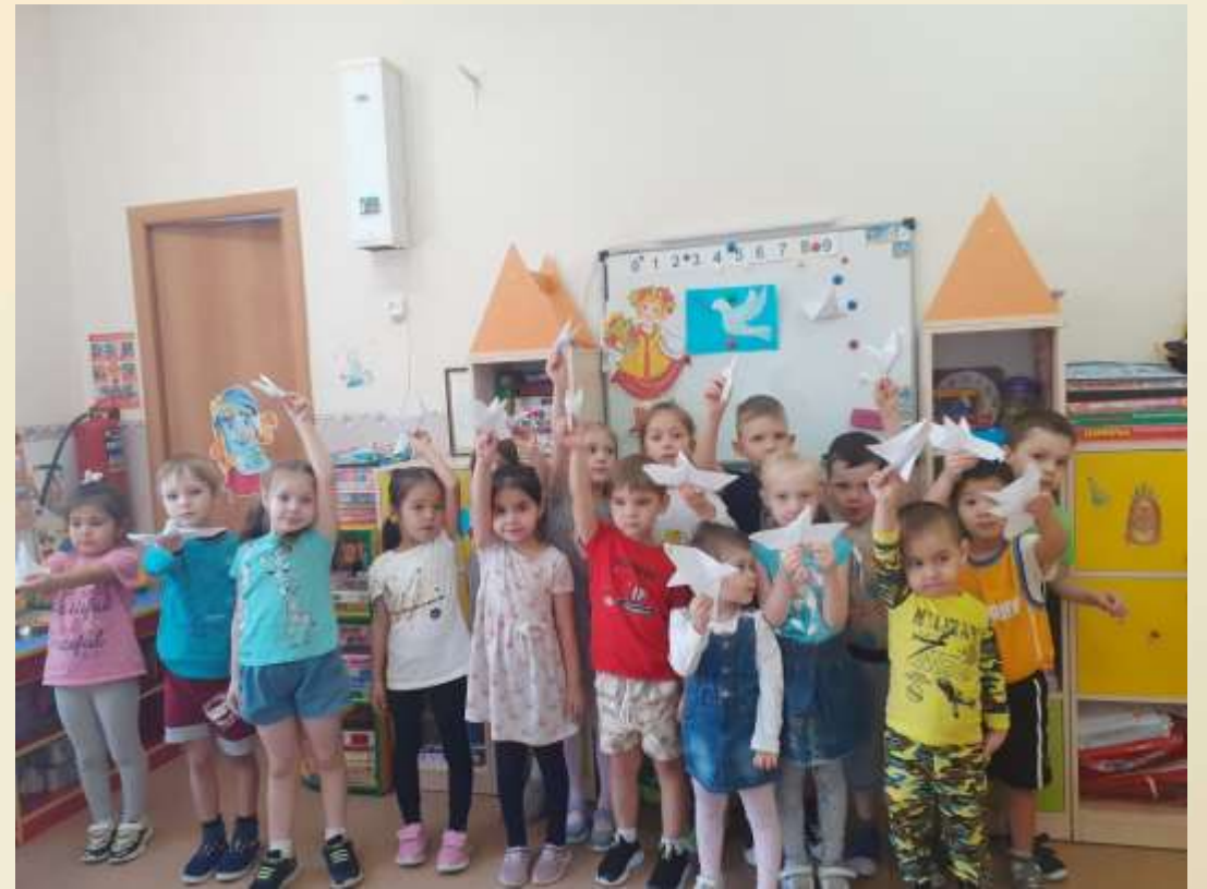
Конструирование голубя –мира из бумаги, техникой оригами.