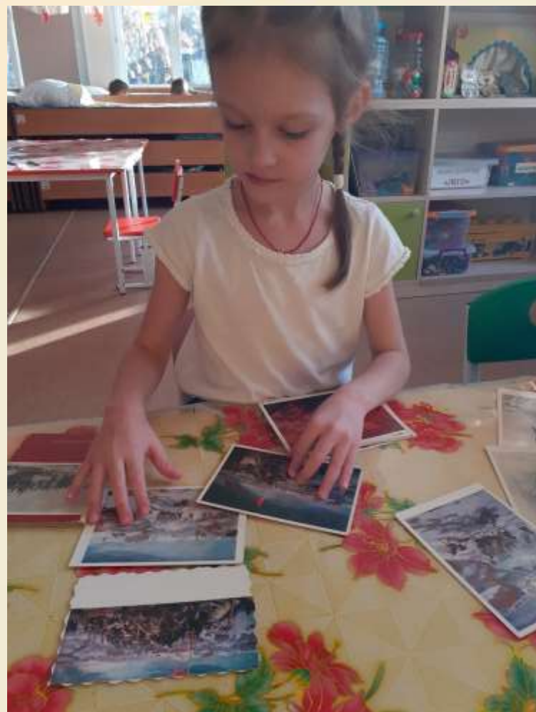
Рассматривание демонстрационного материала.