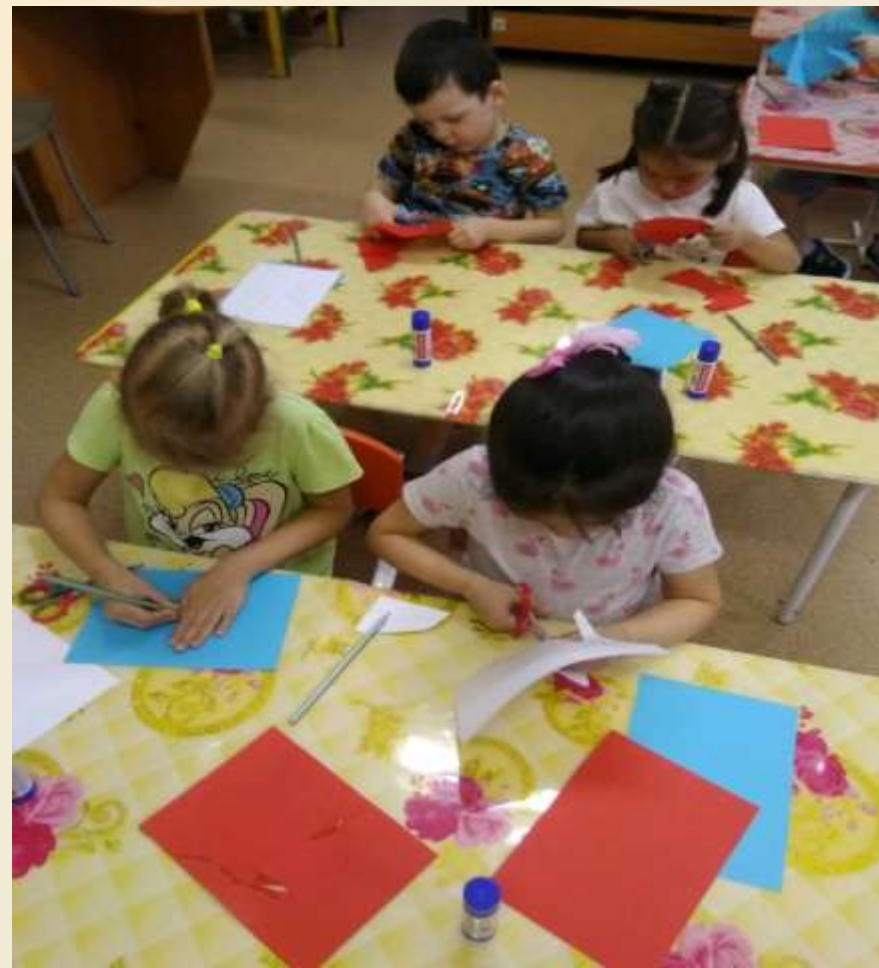
Аппликация : «Голубь –мира».