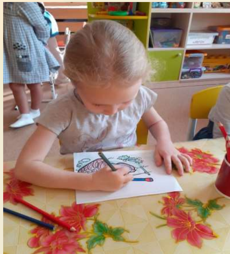
Раскрашивание раскрасок цветными карандашами.