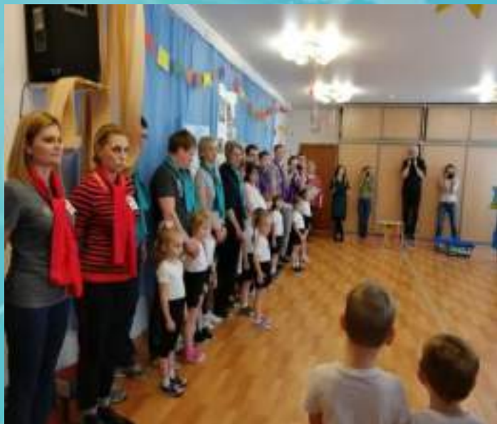
«Курс молодого бойца»