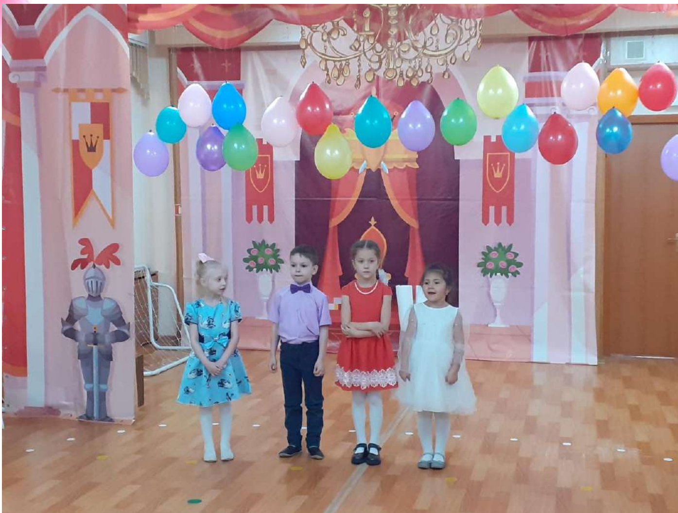
Поздравление милых мам.