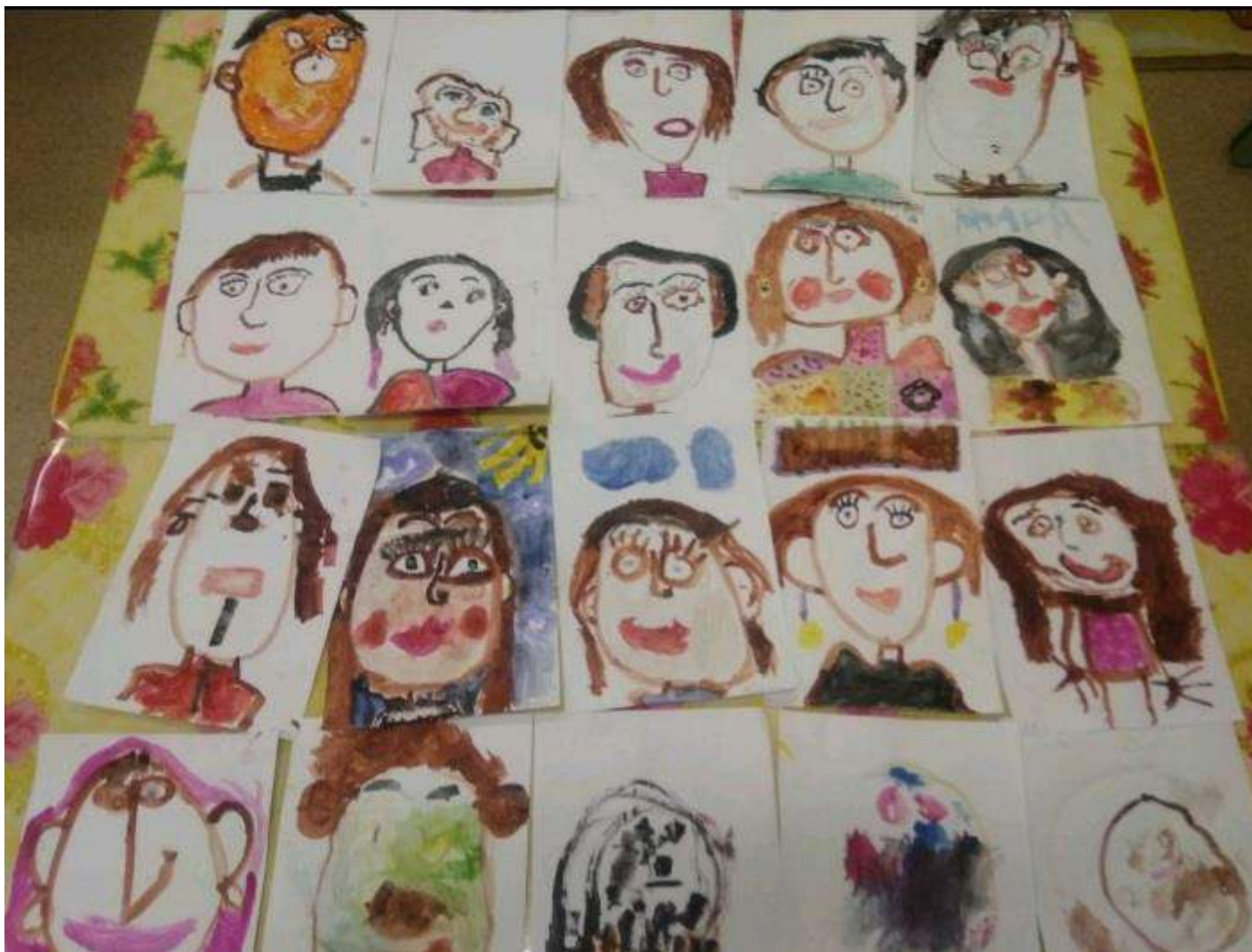
Мамы глазами детей.