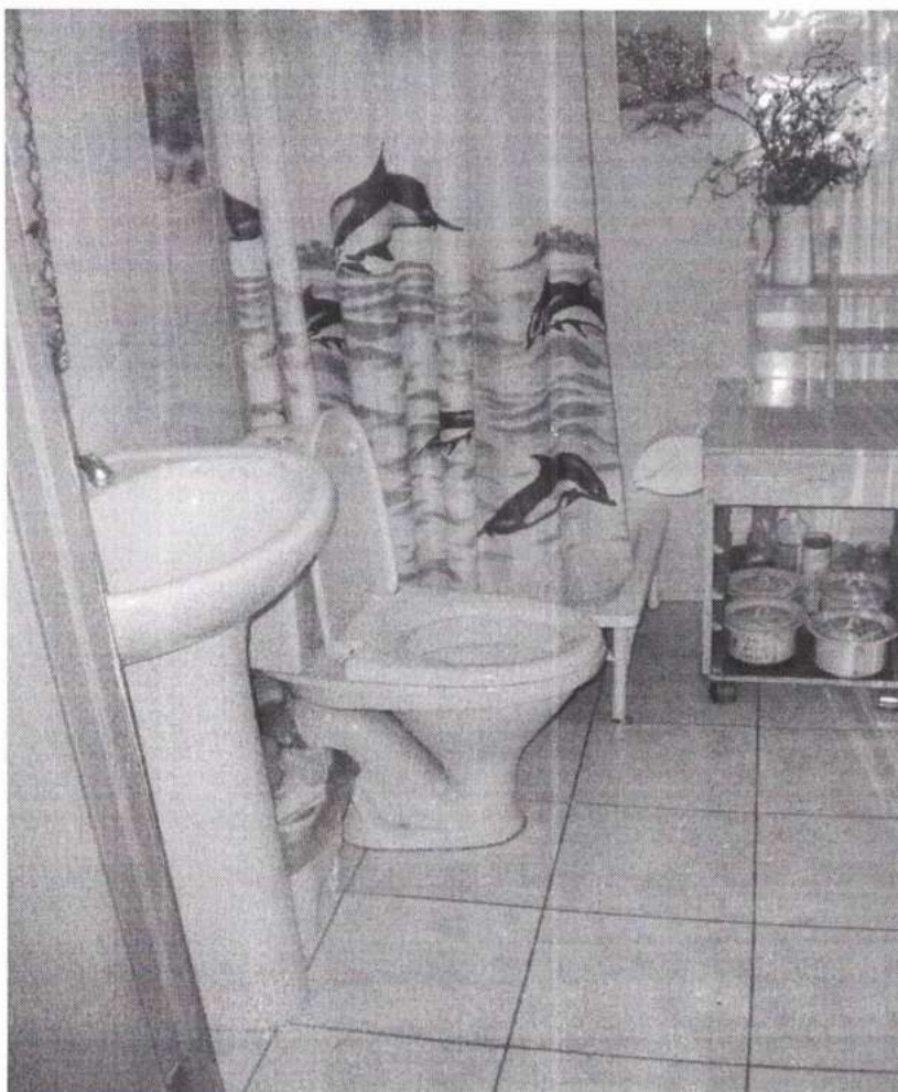
Рисунок № 12