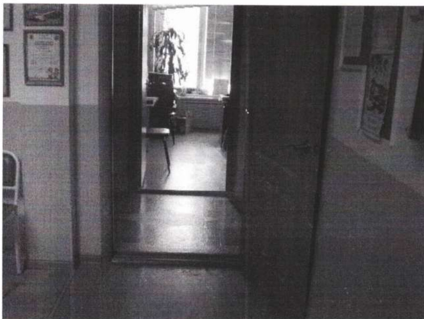
Рисунок № 11