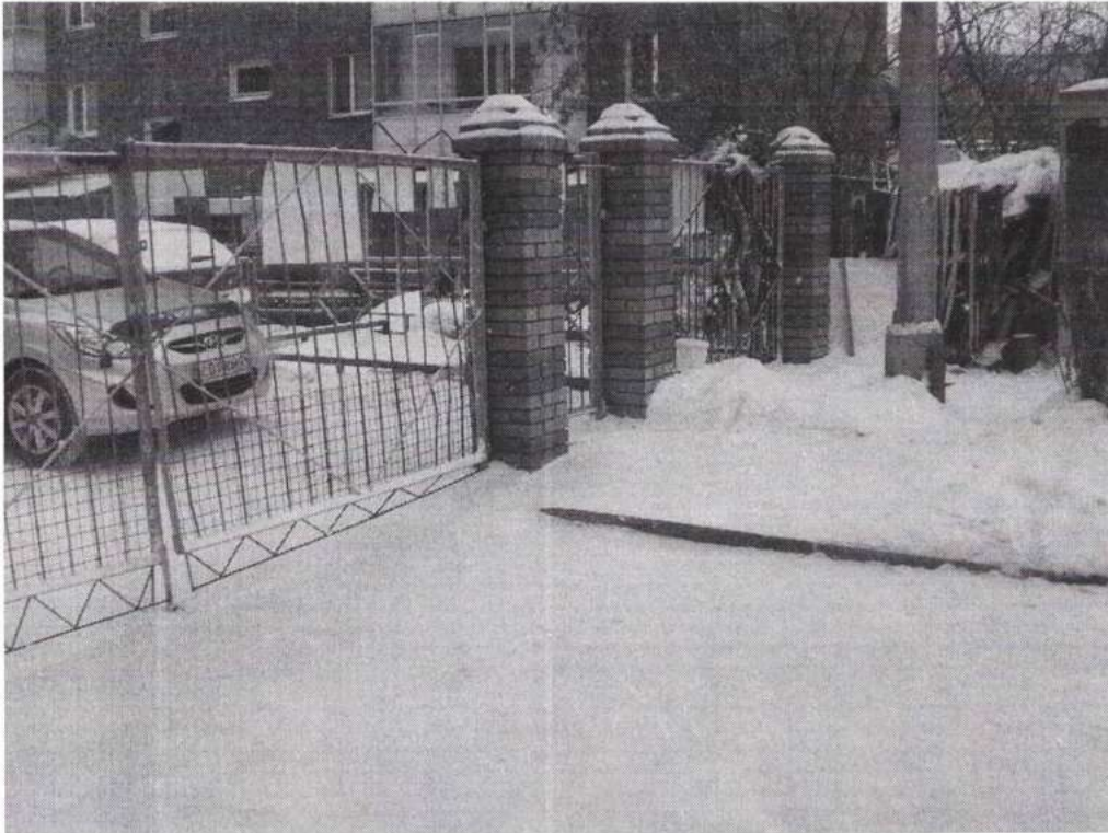
Рисунок № 4