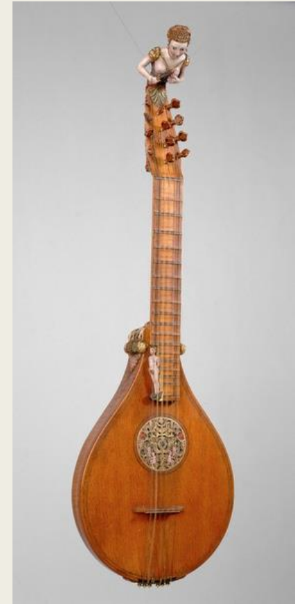
Ці́стра (фр. cistre , от лат. cithara ).