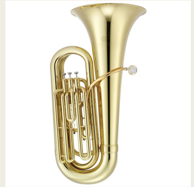
Туба (итал. и лат. tuba — труба)