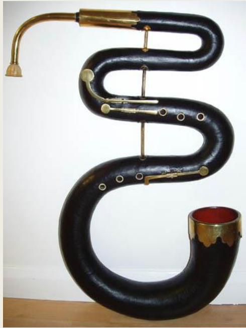
Серпент (фр. serpent — змея)