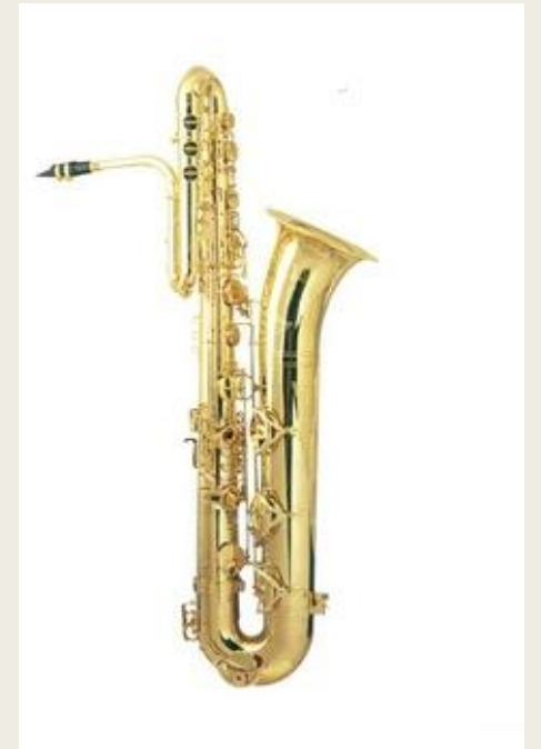
Саксофон (фр. Saxophone ) — тростевой духовой музыкальный инструмент.