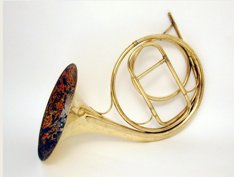
Валторна (нем. Waldhorn — лесной рог, итал. corni , фр. cor , англ. French horn )