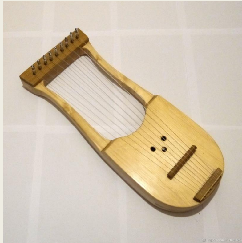
Ли́ра — струнный щипковый инструмент.