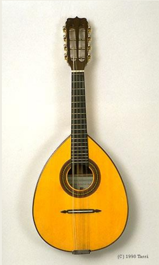
Мандолина (итал. mandolino , уменьшительная форма от итал. mandola — вид лютни).